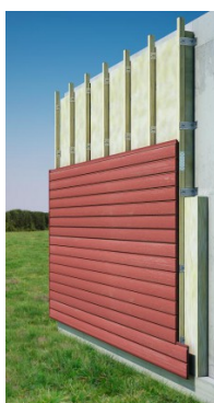
Mise en place d'un pare-pluie