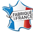
Caisse emboutie avec marquage "Made in France"