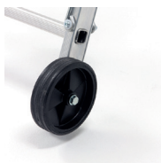
2 roulettes Ø 160 mm pour les déplacements