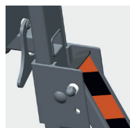
Verrous arrière anti-soulèvement