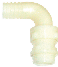
COUDE 3 PIECES CANNELE NYLON MALE 1" x 20