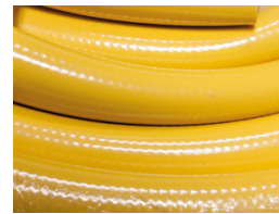
COURONNE DE 25M TUYAU ALFA DIAMETRE 20MM