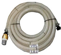
KIT ASPIRATION 7M Ø 20MM MALE 1" AVEC CREPINE A CLAPET