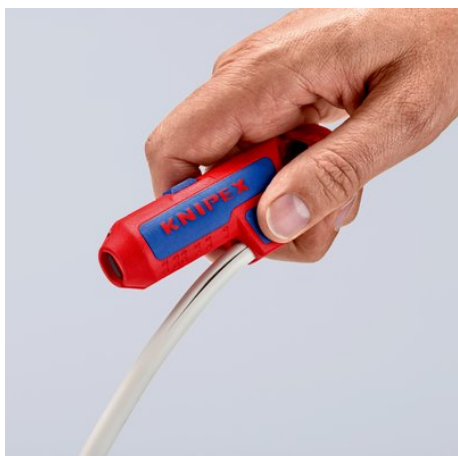
Avec une lame couverte dans une poignée en porte-à-faux latéral pour des coupes longitudinales faciles