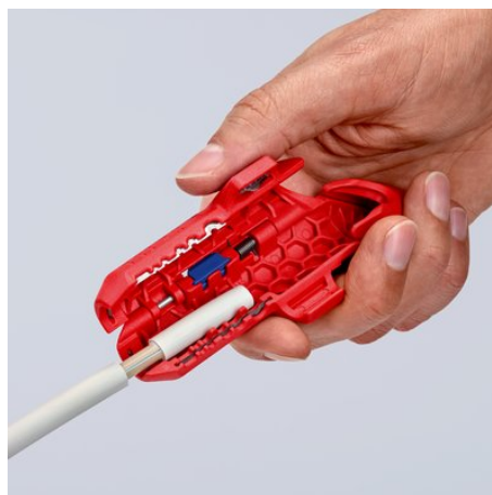
Dégainage d'un câble NYM