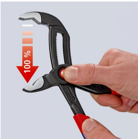
Appuyer sur le bouton – ouvrir intégralement la pince