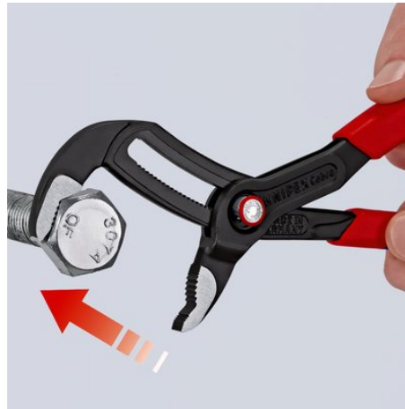
Poser la mâchoire sur la pièce – faire simplement coulisser la pince